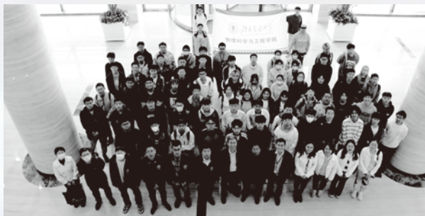
纳米项目学生赴国家电投集团科学技术研究院参观学习