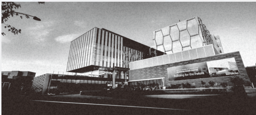
滑铁卢大学 UNIVERSITY OF WATERLOO

北京交通大学是教育部直属，教育部、交通运输部、北京市人民政府和中国国家铁路集团有限公司共建的全国重点大学，是国家“211工程”“985工程优势学科创新平台”“双一流”建设高校。学校位于首都北京“学府胜地”海淀区，毗邻中国“硅谷”中关村，有东西两个校区，总面积1000余亩，建筑面积84万平方米，教学、科研设施完善，校园环境优美。学校始终把人才培养作为办学的根本任务，把建设高素质的教师队伍作为提高办学实力的关键，把加强科技创新作为发展的战略重点，把加强合作交流作为提高办学水平的重要途径，近年来国内外影响力不断提升。