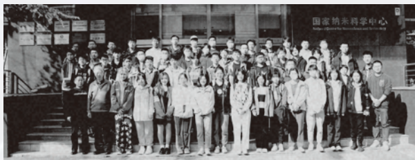
纳米项目学生赴国家纳米科学中心参观学习

https://nano.bjtu.edu.cn/cms/itcm/76.html