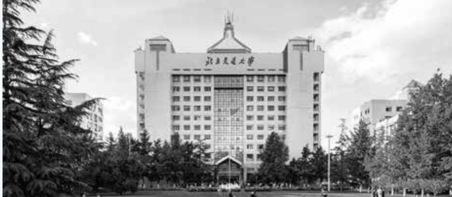
北京交通大学 BEIJING JIAOTONG UNIVERSITY