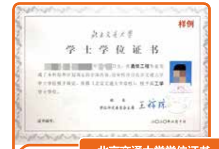
北京交通大学学位证书