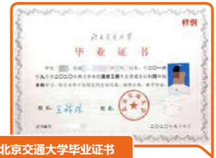
北京交通大学毕业证书