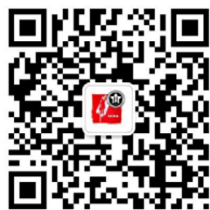
职业发展协会微信