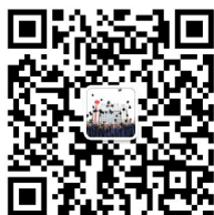
就业指导中心官方微信

职业发展协会协助就业指导中心举办各类特色项目，多次获得“北京市职业类十佳社团”、“甲级社团”等荣誉称号，欢迎大家加入~